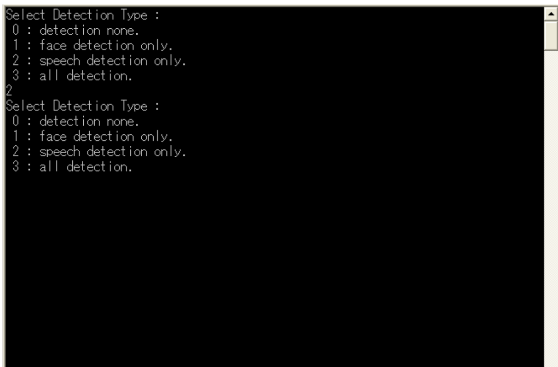
図 3 InDetectionTypeComp 実行画面